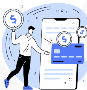
seus hábitos de consumo