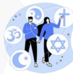
sua preferência religiosa

Agora fica fácil você compreender que o uso mal intencionado desses dados pode criar muitos problemas, como ocorre com os conhecidos golpes de boletos bancários, fraudes em contas de aplicativos, abertura indevida de contas bancárias e de consumo.