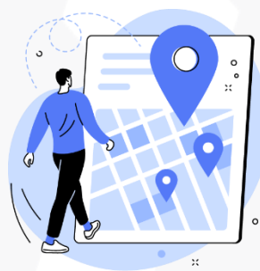
seus hábitos de deslocamento